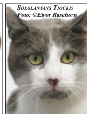
SOLGLÄNTANS TJOCKIS