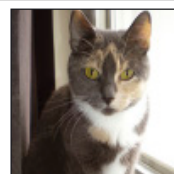
SOLGLÄNTANS MISSY

PRIS vykort: 5:-/st eller 5 st för 20:- + porto 10:- oavsett antal.