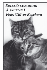
SOLGLÄNTANS MIMMI & SNUTTAN I Foto: ©Eivor Rasehorn

PRIS vykort: 5:-/st eller 5 st för 20:- + porto 10:- oavsett antal.