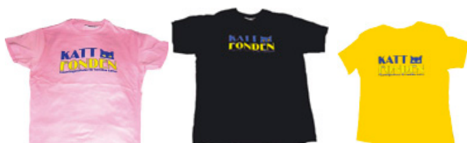
ROSA TJEJTOPP, storlek S – XL. SVART T-TRÖJA, storlek XS och S. GUL TJEJTOPP (OBS! små i storlekarna!), storlek S – XL. PRIS: 160:- + porto 25:- oavsett antal.