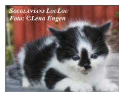
SOLGLÄNTANS LOU LOU