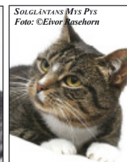
SOLGLÄNTANS MYS PYS