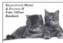
SOLGLÄNTANS MIMMI & SNUTTAN II