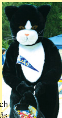
forts sid 2 ➔