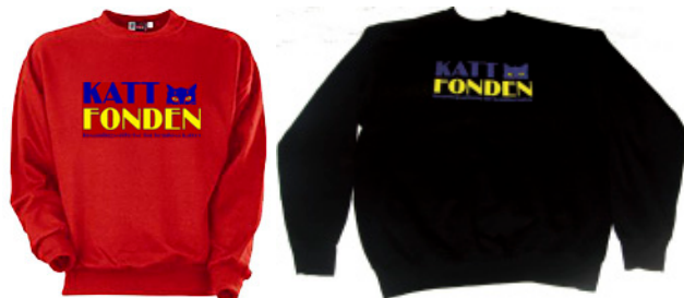
RÖD OCH SVART COLLEGETROJA, storlek S – XXL, PRIS: 270:- + porto 45:- oavsett antal.

Tröjorna kommer från www.nlt-scandinavia.se NLT Scandinavia AB