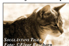
SOLGLÄNTANS TIGER