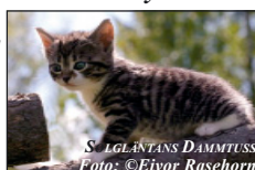
SOLGLÄNTANS DAMMTUSS