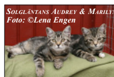
SOLGLÄNTANS AUDREY & MARILYN