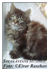
SOLGLÄNTANS MUMMEL