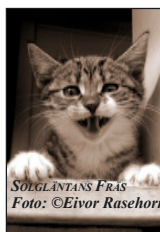
SOLGLÄNTANS FRÄS